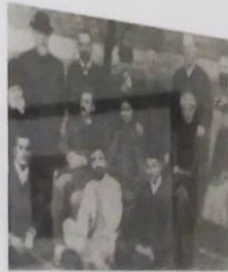
Gandhi in der Vegetarischen Gesellschaft London (1)

Ich las Henry Salt's Buch von vorn bis hinten und war stark davon beeindruckt. Seit dem Zeitpunkt der Lektüre dieses Buches kann ich behaupten, aus eigener Wahl Vegetarier gewesen zu sein. Nun war die Wahl getroffen zugunsten des Vegetarismus, dessen Verbreitung fortan meine Mission wurde."